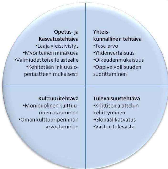
Kuva 2. Perusopetuksen tehtävä

Perusopetus on koulutusjärjestelmän kivijalka ja samalla osa esiopetuksesta alkavaa koulutusjatkumoa. Perusopetus tarjoaa oppilaille mahdollisuuden laajan yleissivistyksen perustan muodostamiseen ja oppivelvollisuuden suorittamiseen. Se antaa valmiudet ja kelpoisuuden toisen asteen opintoihin. Se ohjaa oppilaita löytämään omat vahvuutensa ja rakentamaan tulevaisuutta oppimisen keinoin.