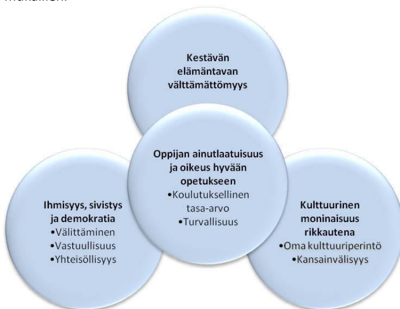
Kuva 1. Raahen perusopetuksen arvo perusta

Raahen perusopetuksen arvo perusta on laadittu Perusopetuksen opetussuunnitelman arvo perustaa mukailleen.