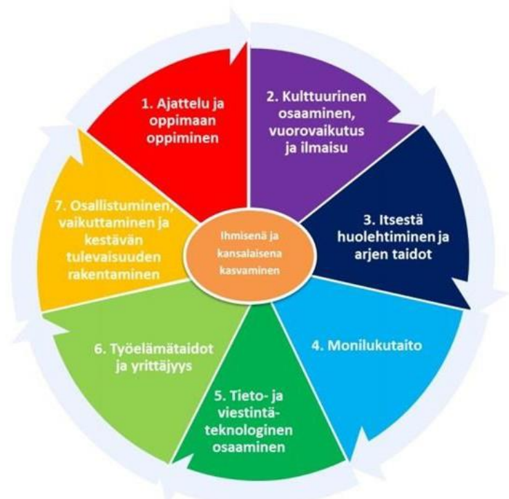
Kuva 3. Laaja-alainen osaaminen (Opetushallitus)

Laaja-alaisen osaamisen tavoitteet täsmennetään luvuissa 13, 14 ja 15 vuosiluokkakokonaisuuksittain. Tavoitteet on otettu huomioon oppiaineiden tavoitteiden ja keskeisten sisältöalueiden määrittelyssä. Oppiainekuvaluksissa osoitetaan oppiaineiden tavoitteiden yhteys laaja-alaiseen osaamiseen.