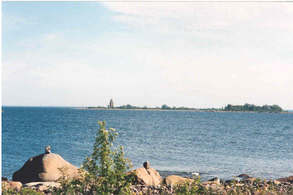
Näkymä Kallasta Taskuun ja Taskunlukkoon

Yksityiskohtaiset luonnonympäristön kuvaukset on esitetty tähän kaavaselostukseen liittyvässä perustietoraportin kohdassa 15.8 Saarikohtaiset luonnonympäristön kuvaukset ja kasvillisuuteen liittyvät tarkat tiedot on esitetty perustietoraportin kohdassa 15.5 Kasvillisuus.