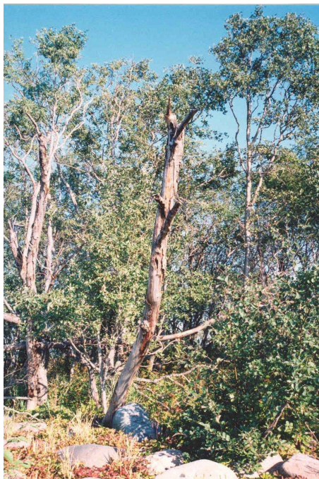
Rääpökkä kuuluu Natura 2000 –suojeluohjelma-alueeseen

Rakennuslain nojalla toteutettavaan Natura 2000 –suojeluohjelma-alueeseen kuuluvat Raahen saariston pienehköt saaret ja luodot on esitetty kaavamerkinnällä: ”Retkeily- ja ulkoilualue, jolla ympäristö säilytetään. Alue kuuluu rakennuslain nojalla toteutettavaan Natura 2000 –suojeluohjelma-alueeseen”.