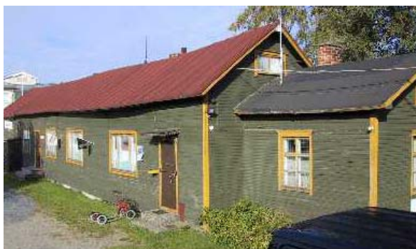
Raabe 5. kaupunginosan korttelin 18 rakennushistoriaselvitys