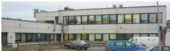
Raaha 5. kaupunginosan korttelin 18 rakennushistoriaselvitys