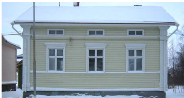
Raaha 5. kaupunginosan korttelin 18 rakennushistoriaselvitys