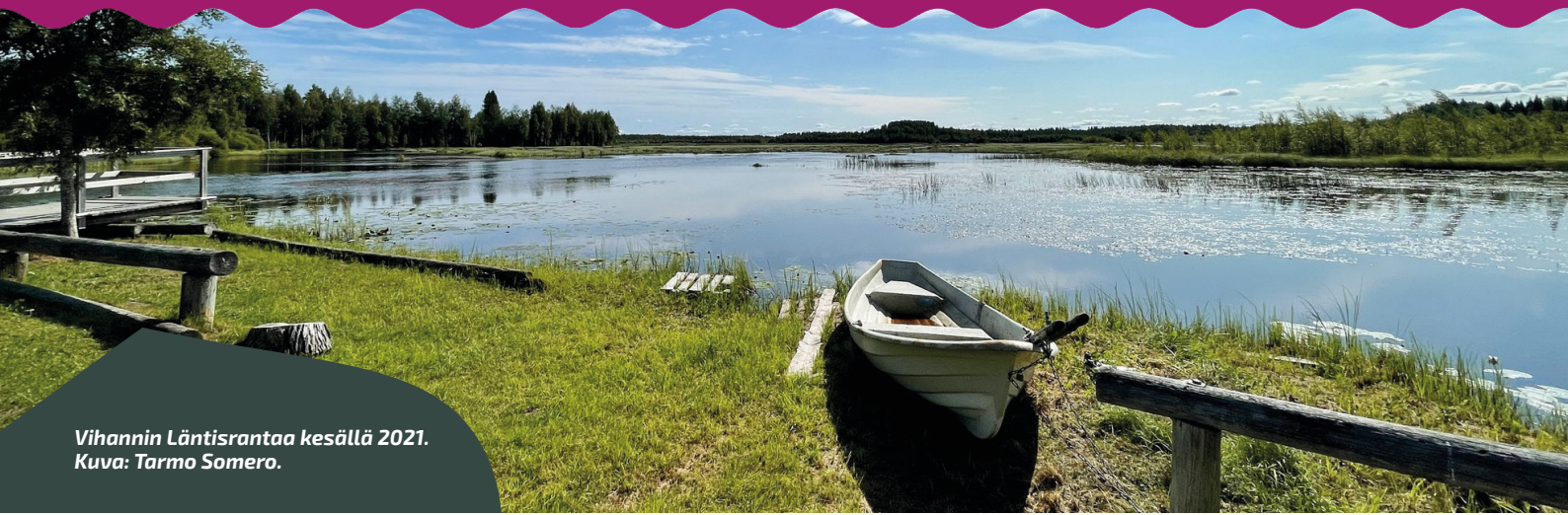
Vihannin Läntisrantaa kesällä 2021.