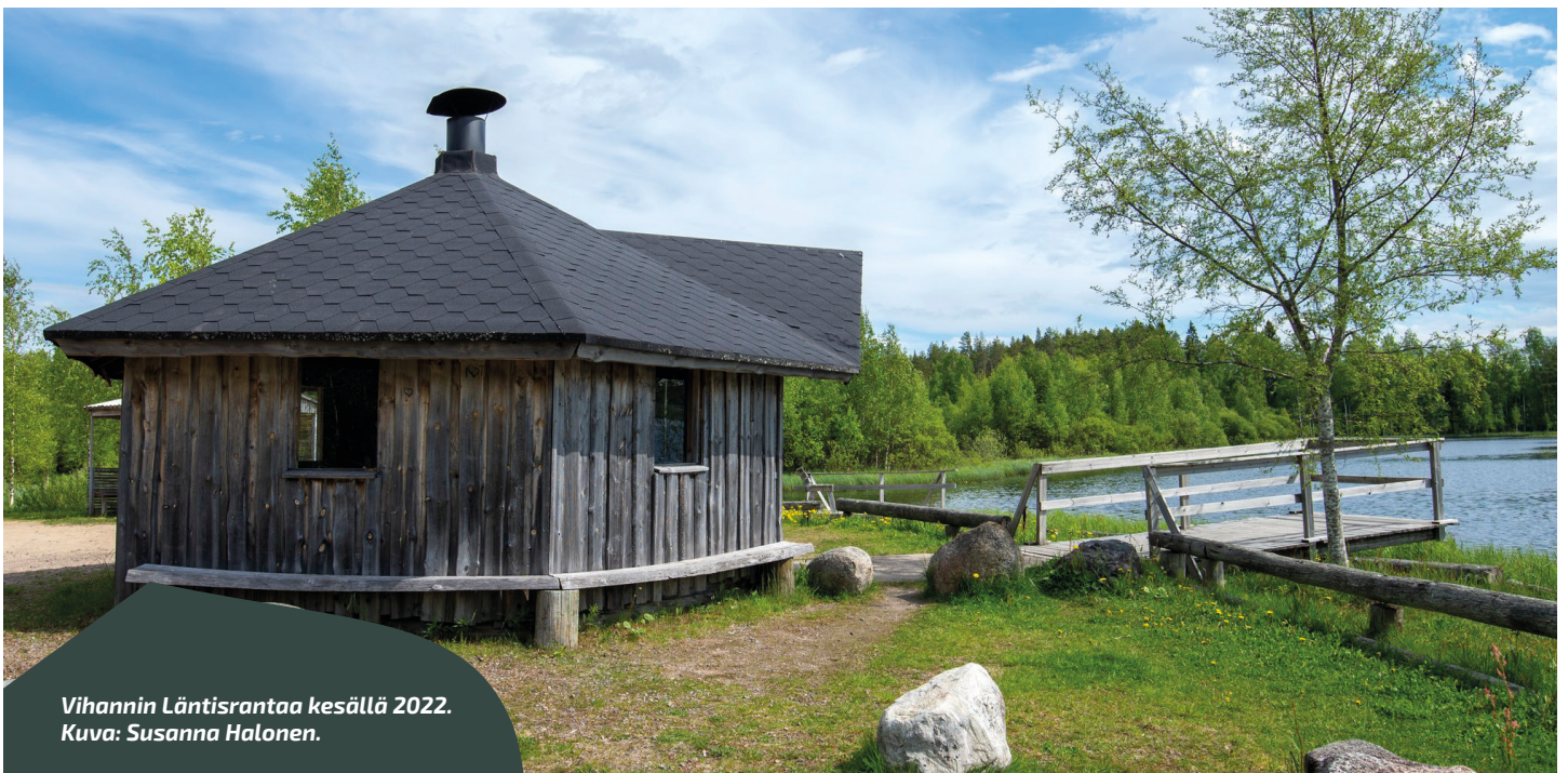
Vihannin Läntisrantaa kesällä 2022.

raivauksiin vaikkapa mahdollisuutena saada nuoria ja muita työllistettäviä em. töihin. - Kylien tiivistyvä yhteistyö, jota voisi auttaa jonkinlainen vahvuuksien kautta tuleva työnjako yhteiseksi hyväksi.