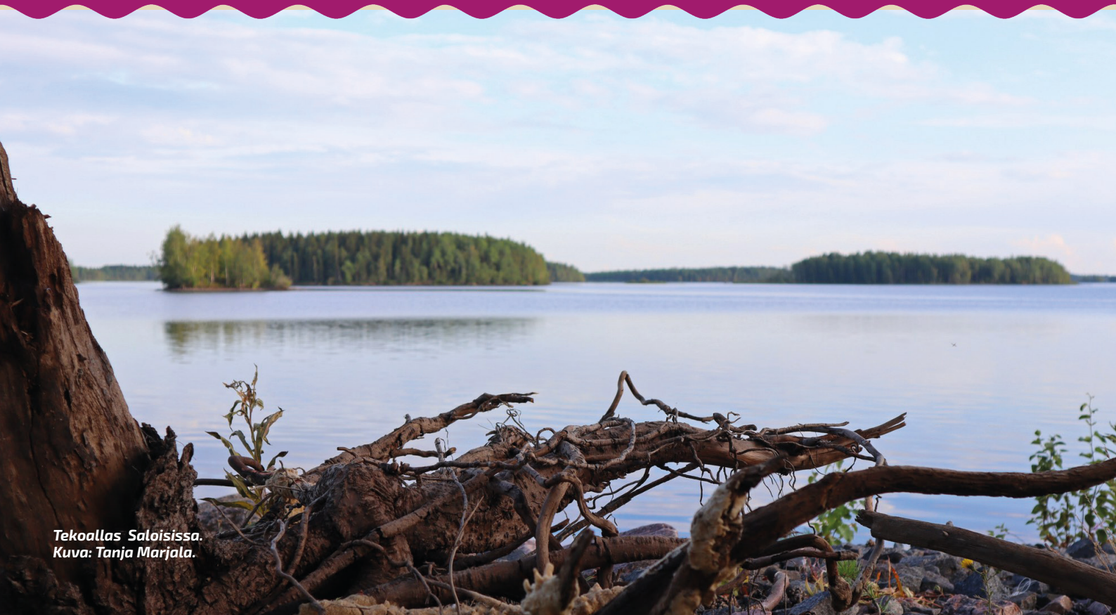
Tekoallas Saloisissa.