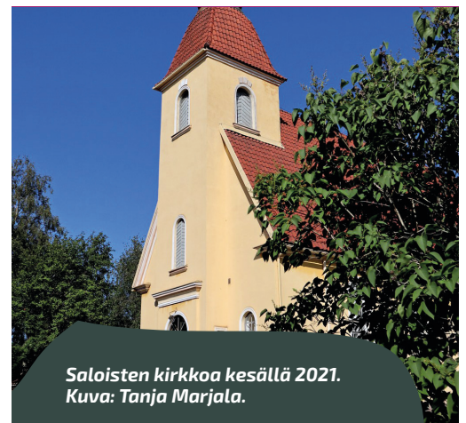
Saloisten kirkkoa kesällä 2021.