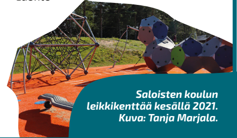
Saloisten koulun leikkikenttää kesällä 2021.