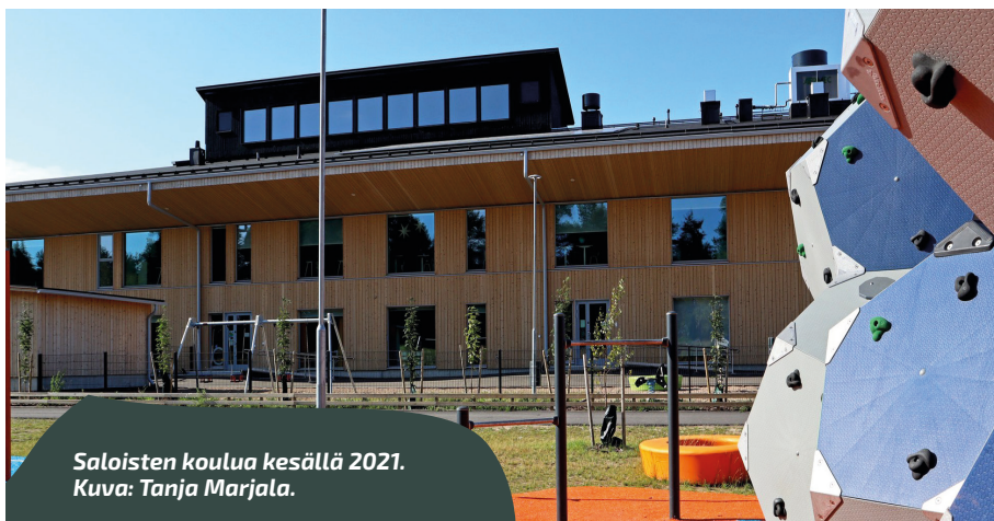
Saloisten koulua kesällä 2021.