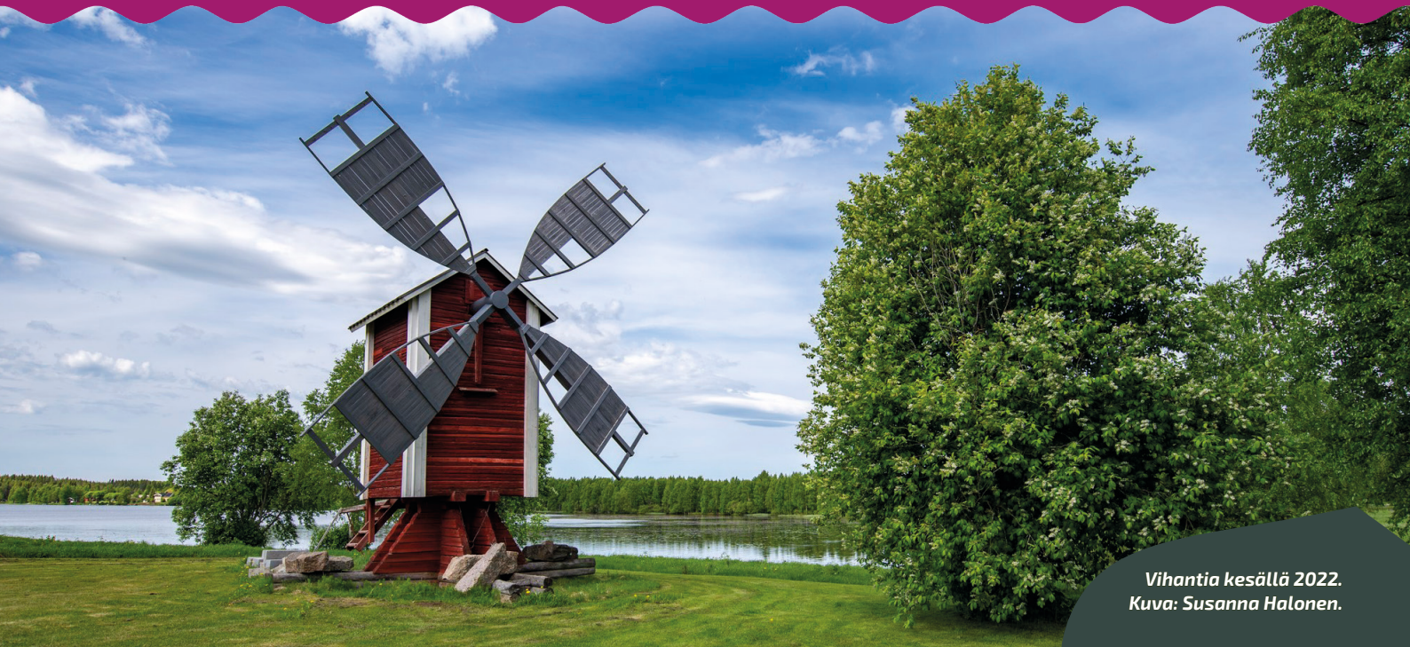
Vihantia kesällä 2022.